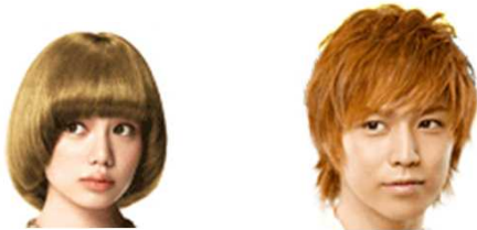
4_イエローブラウン系