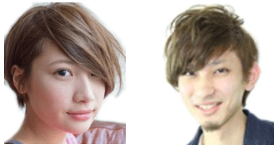
14_アンシンメトリー