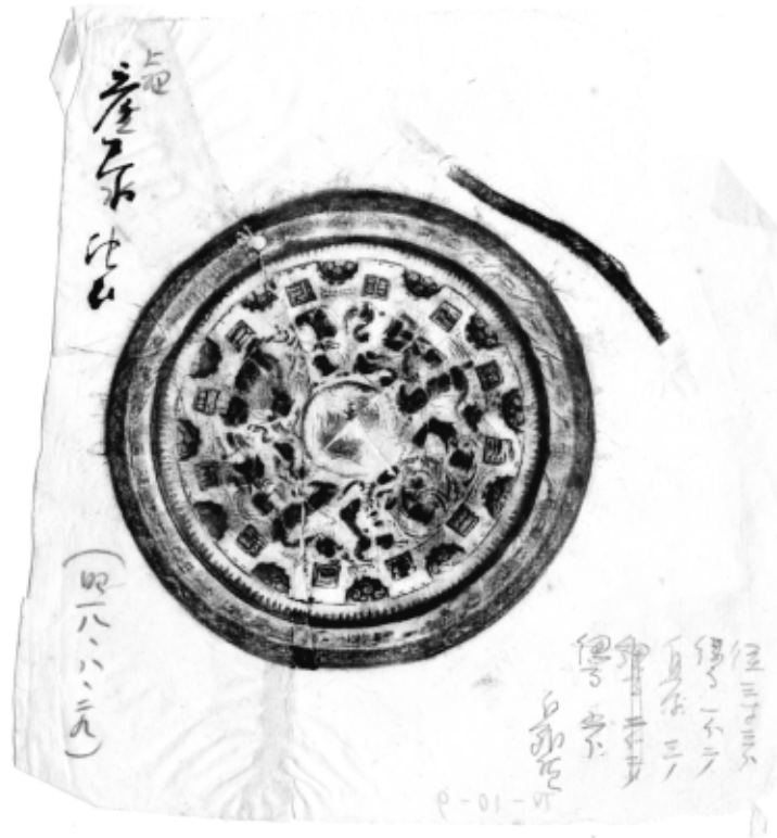
第10図 画文帯神獸鏡 上野国産泰神社 S18. 8 .29 (IV-10- 9) S=2/3